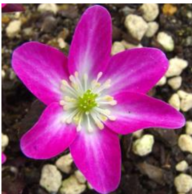
`Rot weißes Auge`