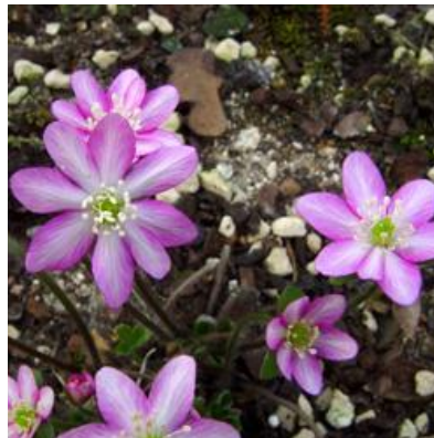
`Rot Weiß gestreift`